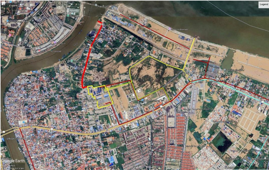
រូបភាព ១៖ បង្ហាញពីទីតាំងប្រព័ន្ធលូបង្ហូរសំណល់រាវចេញពីក្នុងទីតាំងគម្រោង

គម្រោងពង្រីកប្រព័ន្ធប្រព្រឹត្តិកម្មទឹកស្អាតនិរោធន៍ (ដំណាក់កាលទី៣) នឹងធ្វើការបង្ហូរសំណល់រាវតាមប្រព័ន្ធលូបង្ហូរសំណល់រាវ (ខ្សែពណ៌ក្រហម) ដែលមានស្រាប់ចេញពីទីតាំងគម្រោងចូលទៅក្នុងទន្លេបាសាក់ ដែលមានបង្ហាញនៅក្នុងរូបភាពខាងក្រោម៖